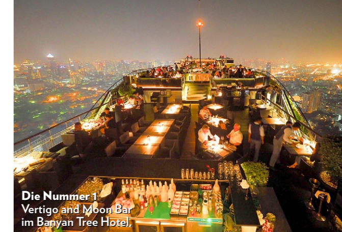
Die Nummer 1: Vertigo and Moon Bar im Banyan Tree Hotel.