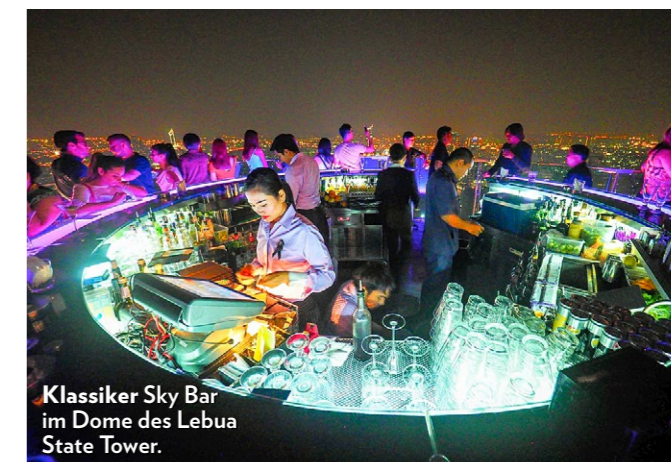
Klassiker Sky Bar im Dome des Lebua State Tower.