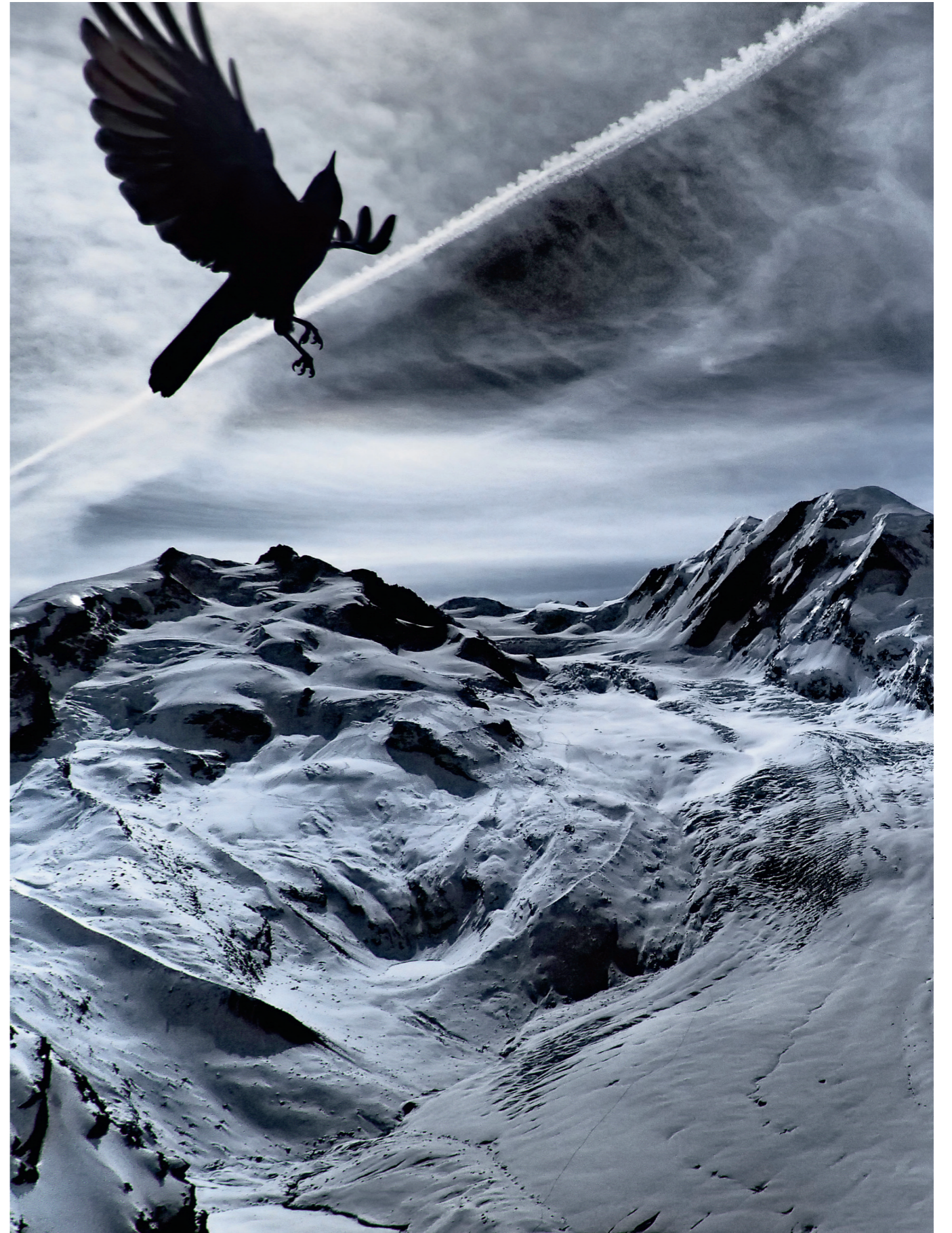
Monte Rosa Glacier, Valais