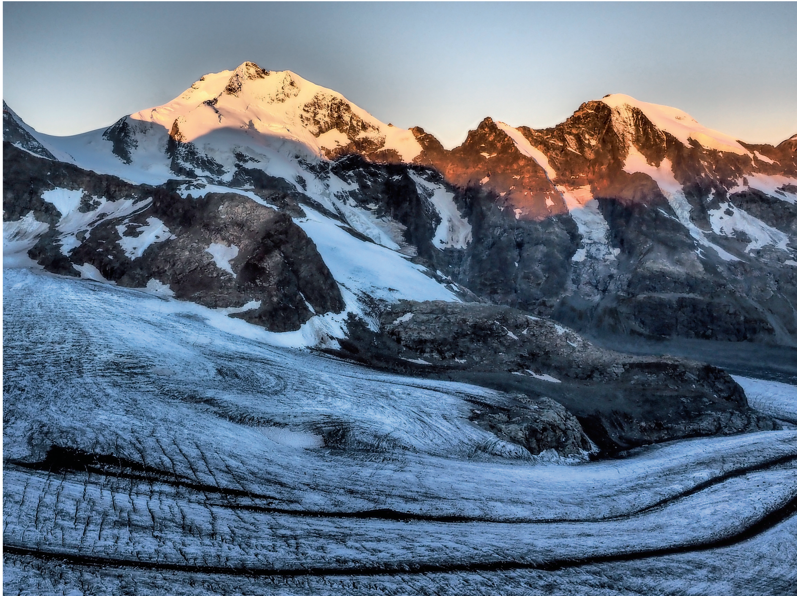
Bernina Valley, Graubünden